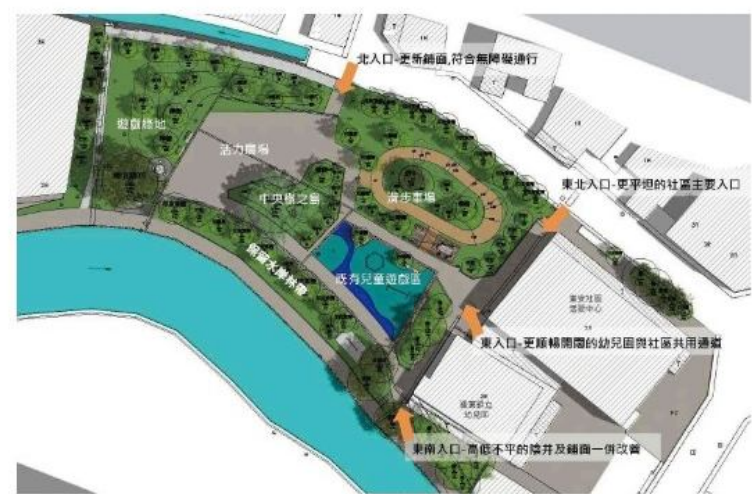
東安公園周邊環境營造計畫的工程示意圖。

東安公園位於鐵路以東的密集住宅區，周邊緊鄰社區活動中心、幼兒園及十六份圳，公園的大樹雖美，但設施老舊。鎮公所為了提升居民生活品質，以東安公園為核心，串聯周邊的服務設施及動線，向中央爭取核定經費五百萬元，推動「羅東鎮東安公園周邊環境營造計畫」，目前施工中。 該計畫全區面積包含公園用地、道路、河川用地大約一點五公頃，綠蔭草坪與公園北邊的十六份圳，綠地流水景觀風貌，在這裡可以看到藍綠交會的節點，建構氣氛輕鬆的水岸林帶。 公園使用對象以東安里民及羅東鎮民為主，特別是緊鄰的東安社區活動中心長青食堂及長照的參與長者、鎮立幼兒園東安分所的小朋友。 鎮公所為了把東安公園打造成親子、老少同享的共融園地，未來在公園東側入口整理出開闊的通道，與幼兒園及社區共用，東北方鋪陳更平坦的社區主要入口、北邊入口更新鋪面以符合無障礙通行需求；至於在園區則有滑步車場、中央樹之島、活力廣場及遊戲綠地，假日也可以做為附近飯店旅遊遊客的休憩空間。