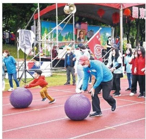
老中青全民運動一起來。

另外，羅東鎮公所代表隊參加一一二宜蘭縣運動會，榮獲七十八面金牌、四十三面銀牌、五十六面銅牌及團體總錦標第二名，鎮公所特別頒發一百一十一萬六千元獎金給予選手、教練，表示對運動員的鼓勵與肯定。