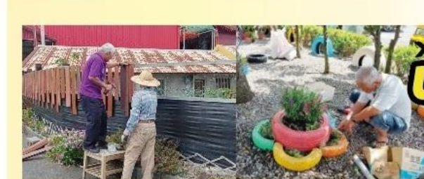
北成社區低碳永續家園木質地板再利用。北成社區榮獲全國低碳永續家園評等銅獎。

這個台灣面積最小、人口密度最高的城鎮，每逢夏天，迎來小鎮旗幟盛典——羅東藝遊節！藝遊節凝聚社區營造的動力，激發全鎮居民熱情參與，吸引藝文團隊投入，展現與國際接軌的文化魅力，與秋齡鎮長感謝每位參加活動的民眾與走進小鎮的遊客，共同成就地方盛事。 邁入第二十二年的羅東藝遊節以「藝遊味勁」為主題，文創、表演、行旅、童趣、踩街、產業連結為核心，十五天活動包含戲劇、音樂表演、街舞大賽、夜間遊行、市場巡禮、文藝市集等，鎮公所還與知名的「Zig貼圖」醜白兔合作，以宜蘭腔「勁」諧音，推出羅東藝遊節醜白兔大勁擊貼圖，逗趣可愛。