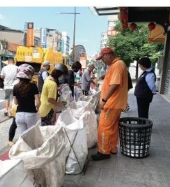
五個定點專區增至七個，方便民眾倒垃圾。

完成太陽光電建置 節電績效宜蘭第一 羅東鎮公所配合再生能源政策，選擇轄管公有建物屋頂及公所前方停車場共十五處，設置屋頂或地面型太陽光電設備，民國一十一年十二月完成建置，每年發電量超過一百一十四萬度，減碳五百八十二公噸，相當於二點二座大安森林公園一年吸碳量，發電回饋一百二十萬元挹注鎮庫收益，兼具綠電、活化公產及屋頂隔熱防水等效益。 鎮公所以身作則節約用電，台電從各縣市挑出節電度數最高的行政區，去年評比二十二個縣市夏月節電中，羅東鎮榮獲宜蘭縣節電績效第一名，吳秋齡鎮長感謝鎮民配合能源共享，為環境努力，讓節電成為引以為傲的生活態度。