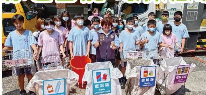
定時定點垃圾收運3.0，服務再升級。

環保減碳 汰換免費社區觀光巴士 鎮公所鼓勵民眾搭乘大眾運輸系統，從推動免費社區觀光巴士接駁服務以來，藍、紅、橘三線每個月約一萬二千接駁人次，今年採購兩輛最新六期環保車輛，進行汰換年限已屆滿的車輛，預計投入藍線接駁專線。目前免費觀光巴士普及全鎮，減少汽機車上路及排放廢氣，也使得交通更順暢，車身彩繪換新的觀光巴士穿梭市街，成為新亮點。