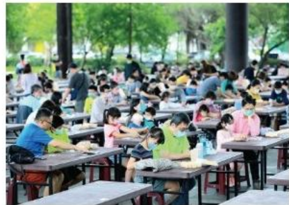
羅東人的羅東拼圖比賽。