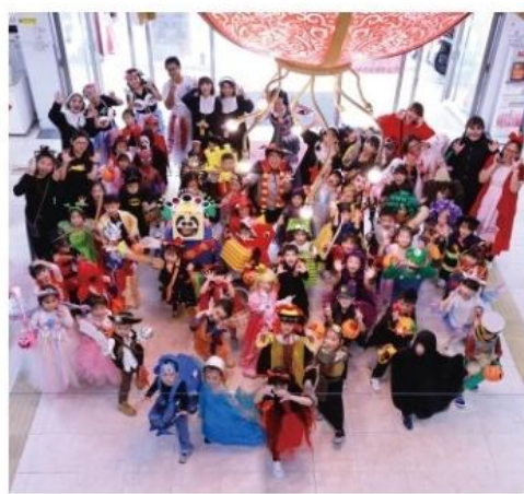
幼兒園萬聖節變裝活動。