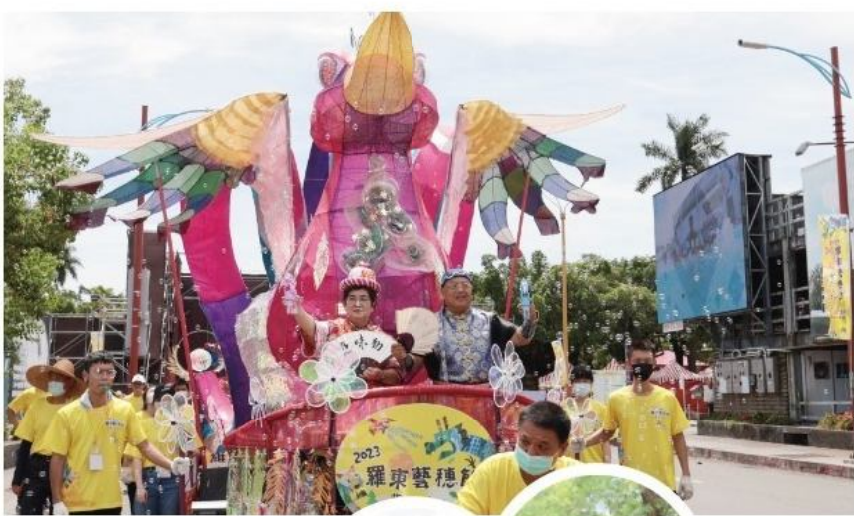
藝遊節的主題花車。

開幕晚會邀請高人氣的紙風車劇團演出《諸葛四郎》大戰魔鬼黨，帶給大人小孩歡樂；藝德益街舞大賽，年輕人的活力四射；中山公園：A劇團表演《阿卡的兒歌大冒險—環島篇》，掀起滿場歡笑。 最後一天精彩的一「藝遊味勁」由社區、學校、團體與遠道而來的姊妹市西都太鼓、神轎隊輪流演出，大家精心打扮，透過定目劇演繹社區故事，共同打造夏日慶典的金字招牌；周邊活動也很豐富，包含傳統市場巡禮、童話故事屋、DIY體驗、文藝市集、拼圖計時賽、手沖咖啡體驗、愛心99扭蛋機等。 根據中華電信大數據統計，十五天活動的參加人數約四十八萬二千三百六十九人次，其中國際觀光客三千九百五十一人次；產業連結推出愛心99扭蛋機，募集發票做愛心，共募集五千三百七十五張發票，帶進一百一十五萬八千七百七十六元商機，成功活絡在地觀光，並幫助公益團體，落實社會責任。