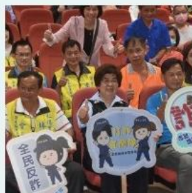
鎮長吳秋齡與里長共同投入反詐宣導。