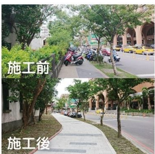
南昌街通學廊道的施工前後對照。

提升道路品質 2.0 推動騎樓整平計畫 一、二年度羅東鎮中正路東側（民生東路至民族路口）騎樓整平工程，以期建立無障礙市容環境，提供安全的優質人行環境系統，這項工程於今年九月開工，總經費三百零三萬元，內政部營建署補助二百五十四萬元、縣政府補助四十九萬元。