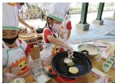
推動食農教育2.0，教育孩子珍惜大地資源。