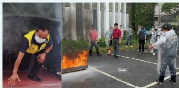
民防訓練濃煙逃生及滅火。