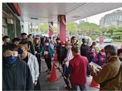
三月初三開放民眾訂桌。