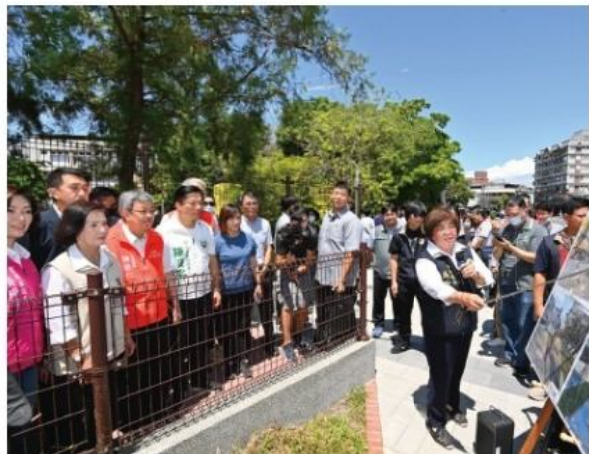
吳秋齡鎮長親自向行政院長陳建仁等人進行通學廊道簡報。

羅東鎮月眉及富農路等汰換管線工程 鎮公所向自來水公司第八區管理處爭取汰換老舊自來水管線，配合東安里及新群里等地區發展，辦理月眉及富農路等汰換管線工程，汰換管線總長度四千八百八十八公尺，工程經費四千二百五十萬元，施作內容包括老舊自來水管線汰換更新及管網改善，今年八月底完工，共一百七十六戶住家受惠，擁有乾淨穩定的飲用水，提升生活品質。