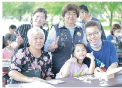
「羅東人的羅東」拼圖比賽，親子同樂。