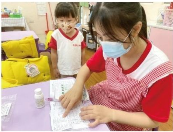
羅東幼兒園宣導藥安全，3讀5對最放心。

為了興建羅東鎮托嬰與托育資源中心，鎮公所向衛生福利部爭取前贈基礎建設，於民國一〇年至一一一年獲得三千多萬元補助；一一二年又再爭取獲得托嬰與托育資源中心開辦費，共五百五十萬元。托嬰與托育資源中心興建工程於去年十一月開工，預計民國一三三年完工營運，期盼打造嬰幼兒更完善的照顧環境，在「好生、好養」政策下提供家長更多元選擇，鼓勵生育，減輕年輕人經濟負擔。 教育界出身的吳秋齡鎮長深感少子化日益嚴重，孩子滿二歲之後不僅沒有幼兒津貼，還要面臨學前教育的銜接問題。鎮公所推出二至三歲幼幼專班，提供一條龍服務，總經費約八千萬元興建的幼幼專班申請取得建照階段，建築本體同時申請候選建築證書，兼具融合自然、健康、美學與實用的生活環境，讓幼兒快樂學習成長。 吳秋齡鎮長表示，「安全」是一切學習的基礎，為了確保幼兒上下課的安全，鎮公所以汰舊換新的方式，購買一輛新款的娃娃車，車內配備雷達測速、倒車影像警示、防撞偵測系統，提供幼兒安全舒適的乘坐環境。 鎮公所同時有感於國內發生學童餵藥風波，為避免造成家長恐慌及保護幼童安全，特別指示羅東鎮立幼兒園依據「幼兒教保及照顧服務實施準則」及縣政府提供幼兒園託藥及餵藥安全基本資訊辦理，教保服務人員受託協助幼兒用藥，應以醫療機構所開立的藥品為限，落實「三讀五對」給藥方式，「三讀」是取出藥袋核對藥單、取出藥包或倒出糖漿時、放回藥袋時；「五對」指的是幼兒對、藥物對、劑量對、時間對、方法對，守護幼兒身體健康。